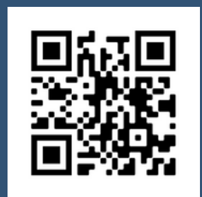
Enteco Concept GmbH